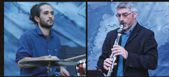
Chansons du Monde