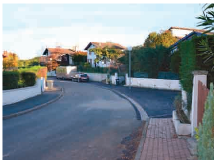
La réalisation du parking du lotissement Aguerria