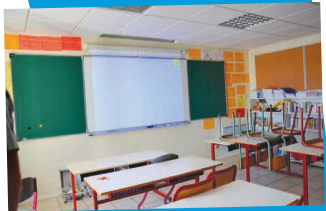
Classe numérique pour l'école d'Elizaberry