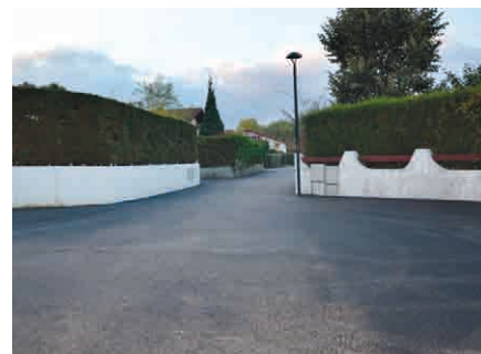
Première partie du lotissement Irauldénia