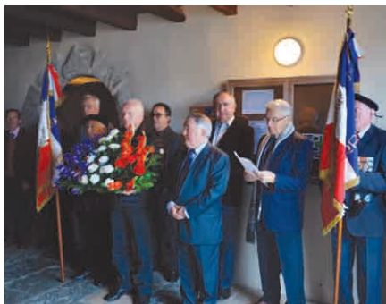
... Et à Elizaberry