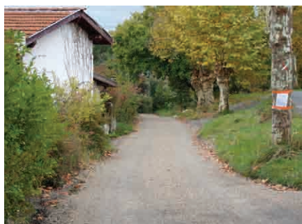
Chemin du Moulin