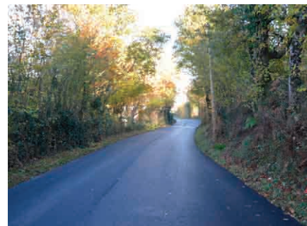
Route de Villefranque