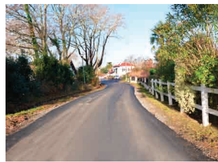
Chemin de Larramendia