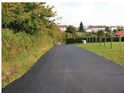
Chemin de Liparxea