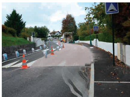
Le plateau ralentisseur avenue de la Rhune