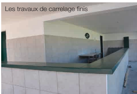
Les travaux de carrelage finis