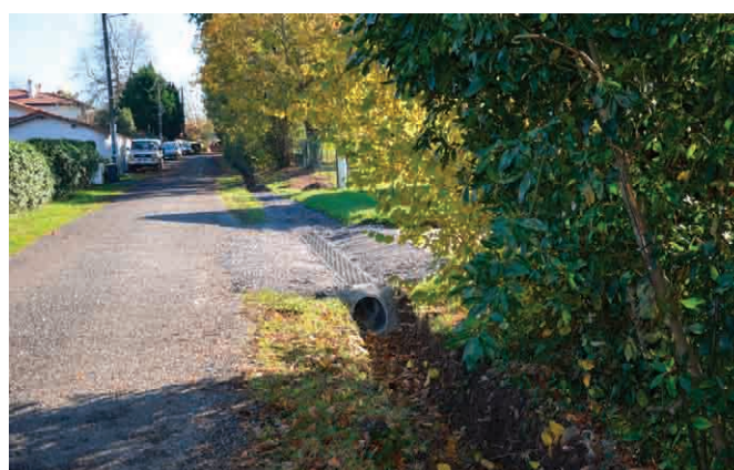
La réalisation du réseau d'eaux pluviales par les services techniques municipaux Chemin de Larramendia