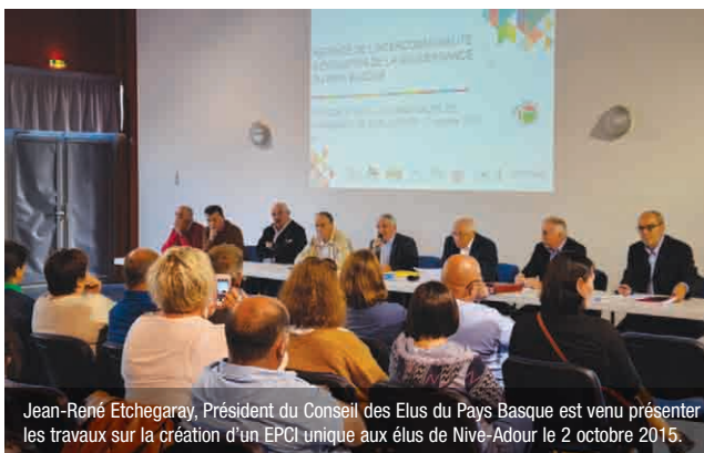
Jean-René Etchegaray, Président du Conseil des Elus du Pays Basque est venu présenter les travaux sur la création d'un EPCI unique aux élus de Nive-Adour le 2 octobre 2015.

Au fil des ateliers, les élus ont privilégié une Communauté d'Agglomération Pays basque, organisation qui offre de la souplesse dans sa mise en œuvre, notamment dans le choix des compétences de la nouvelle entité. Dans les semaines qui viennent, les communes du Pays