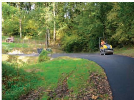
Chemin de Béhigoa