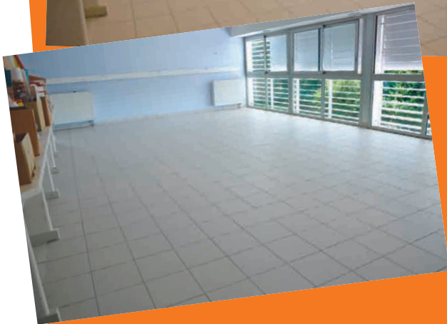
La reprise du carrelage du nouveau bâtiment école du Bourg