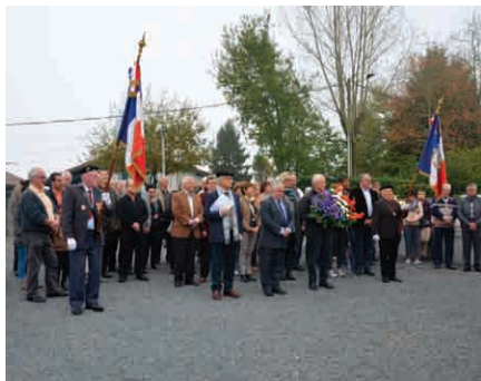
Cérémonie du 11 novembre 1918 au Bourg...