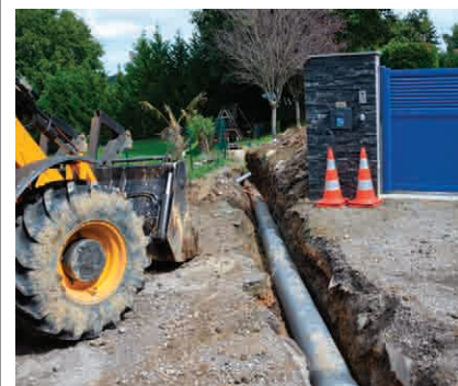
L'aménagement hydraulique du chemin de Cazenave