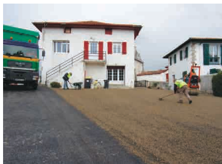
Le parking de la Communauté des communes