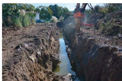
Les travaux hydrauliques aux Salines de Mouguerre