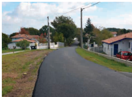
Première partie du chemin de Larretchea