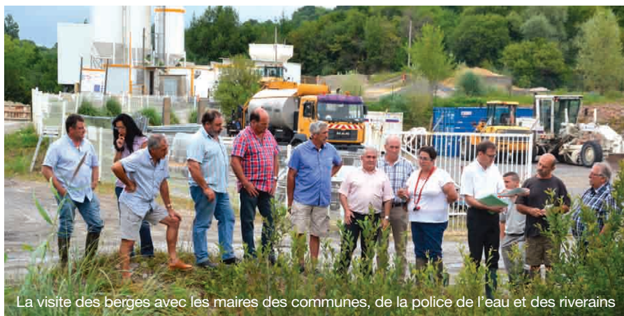
La visite des berges avec les maires des communes, de la police de l'eau et des riverains